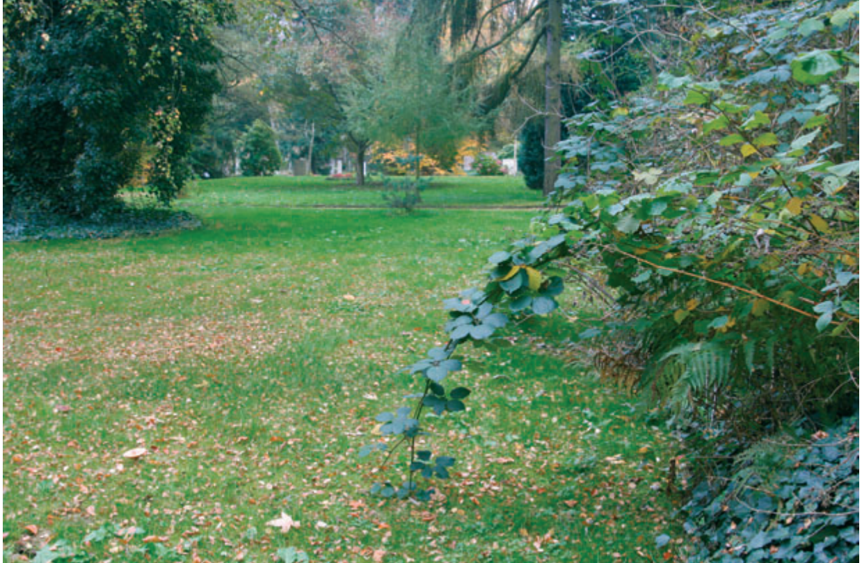
Aufgelassenes Grabfeld auf dem Kasseler Hauptfriedhof

rung, die sich in der Friedhofs-, Bestattungs- und Grabstättenwahl widerspiegelt, ausgerichtet. In einem weiteren bis Frühjahr 2009 laufenden Untersuchungsschritt werden die aktuellen Strategien der Friedhofsverwaltungen im Umgang mit Friedhofsüberhangflächen untersucht, da auch das Bestattungsangebot Einfluss auf die Nachfrage nimmt.