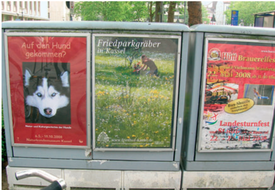
Plakatwerbung für Friedparkgräber in Kassel

obwohl es auf den jeweiligen Friedhöfen auch günstigere Bestattungsformen gibt 12) . Dies mag daran liegen, dass diese Grabstätten als Alternative zu traditionellen Bestattungsformen zu verstehen sind und die Entbindung von der Grabpflege ein wichtiges Entscheidungskriterium darstellt.