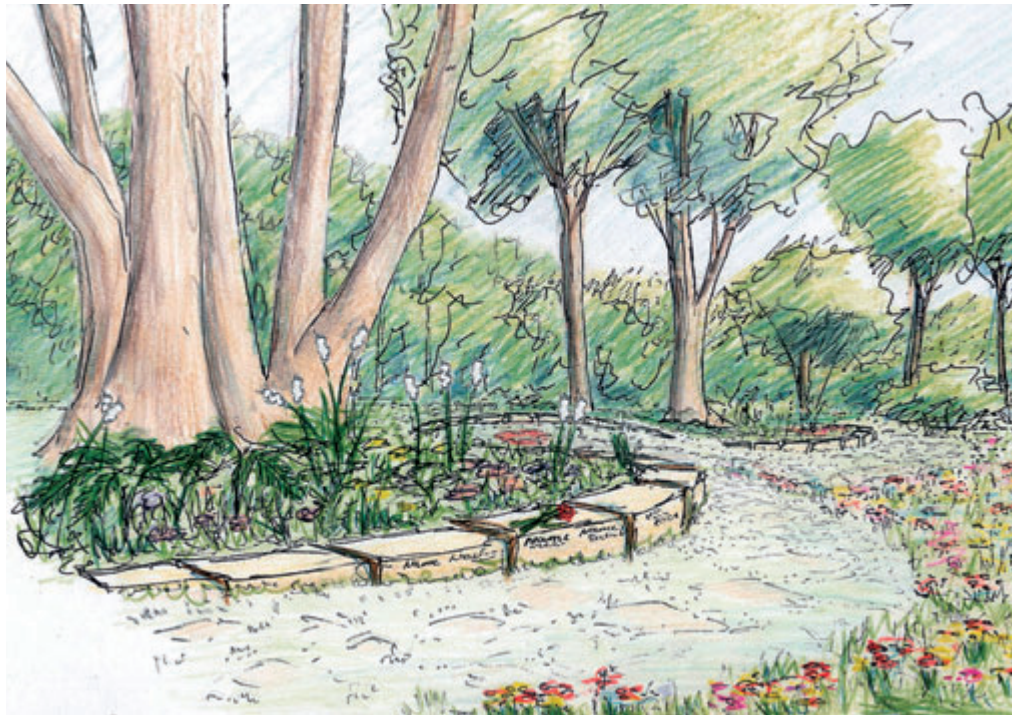
Skizze für das Grabfeld 25 Hauptfriedhof Kassel Zeichnung Büro PlanRat, Kassel, 2008

Die Idee der offenen Wiese leitet sich davon ab, dass diese Flächen mit geringen Pflegekosten unterhalten werden können und zugleich eine Blütenvielfalt geschaffen wird. Das Plakat für den Friedpark Kassel zeigt bereits den frühsummerlichen Blütenaspekt mit Löwenzahn und Wiesen-schaumkraut. Dieser Aspekt kann zum Beispiel gezielt mit Schlüsselblumen und Storchschnabel sowie mit Geophyten ergänzt werden. Eine weitere Idee besteht darin, in der Tradition der Wiesen im Landschaftsgarten und in Anlehnung an die sogenannten Robinsonwiesen Zierstauden einzubringen. Allerdings ist diese Möglichkeit aus ökonomischen Gründen beschränkt (Kosten für Saatgut). Manche Arten sind jedoch nicht teuer und werden bei der Kultivierung von Straßenböschungen und Schutthalden breit eingebracht, z. B. die blaue Lupine, die dauerhaft ist und (zum Leidwesen des Naturschutzes) verwildern kann. Daher wurde eine weiße Sorte in die Saatgutmischung aufgenommen, wodurch der eher dunkle Charakter des Friedhofs aufgehellt wird. Zudem steht die Symbolfarbe „Weiß“ für Tod und Trauer und wird traditionell auf Friedhöfen eingesetzt. Über die Etablierung der laufenden Feldversuche lassen sich gegenwärtig noch keine abschließenden Aussagen treffen. Dies muss einer weiteren Publikation vorbehalten bleiben.